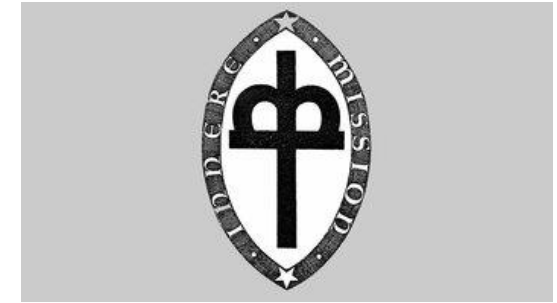
Ursprüngliche Fassung des Kronenkreuzes