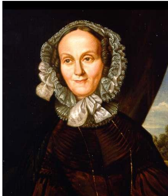
Amalie Sieveking (1794 – 1859) Mitbegründerin der Diakonie Erfinderin der modernen Sozialarbeit