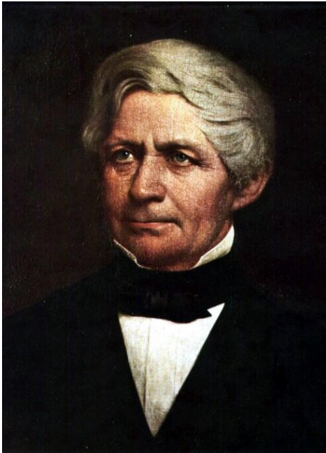
Johann Hinrich Wichern (1808 – 1881) Gründer der Inneren Mission Erfinder des Adventskranzes