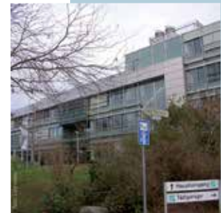
Beginn: Fraunhofer Institut Fraunhoferstr. 5