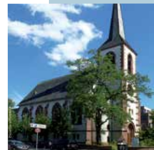
weiter: Stiftskirche Stiftsstr. 12a